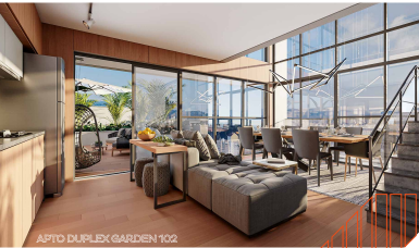
APTO DUPLEX GARDEN 102